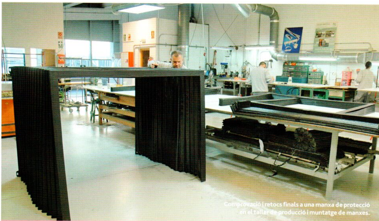
Comprovació i retocs finals a una manxa de protecció en el taller de producció i muntatge de manxes.