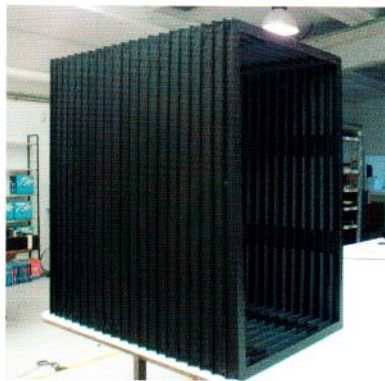
Una manxa de protecció fabricada a Lluís Creus, SL.

Un dels projectes més ambiciosos gestionats des d'aquesta polièdrica empresa ha estat l' Intelligent Caring Bed (ICB). Aquest innovador llit motoritzat es va desenvolupar inicialment per a l'empresa BJ Adaptaciones, dedicada al disseny de solucions tecnològiques per a persones amb discapacitat. A causa de l'empenta que el projecte va prendre durant la seva gestació, va passar a convertir-se en el primer producte d'ICB, una nova marca comercial que opera sota el paraigua de Lluís Creus, SL. La novetat principal d'aquest llit és un sistema de balanceig lateral automàtic i personalitzable que evita la formació d'úlceres per pressió i millora el descans dels malalts amb mobilitat reduïda, i ajuda els usuaris i cuidadors a fer més suportables els períodes de convalescència. Després de posar una seixantena d'unitats al mercat, i amb les homologacions a punt per poder subministrar-lo a hospitals i centres mèdics, l'ICB inicia una cursa comercial que se suposa reeixida si ens fixem en l'acollida que ha aconseguit fins avui. "El desenvolupament d'aquest producte ha estat molt estimulante a tots els nivells —recalca Creus—. El retorn que estem rebent dels usuaris afegeix un component humà que mai abans no havíem expe-